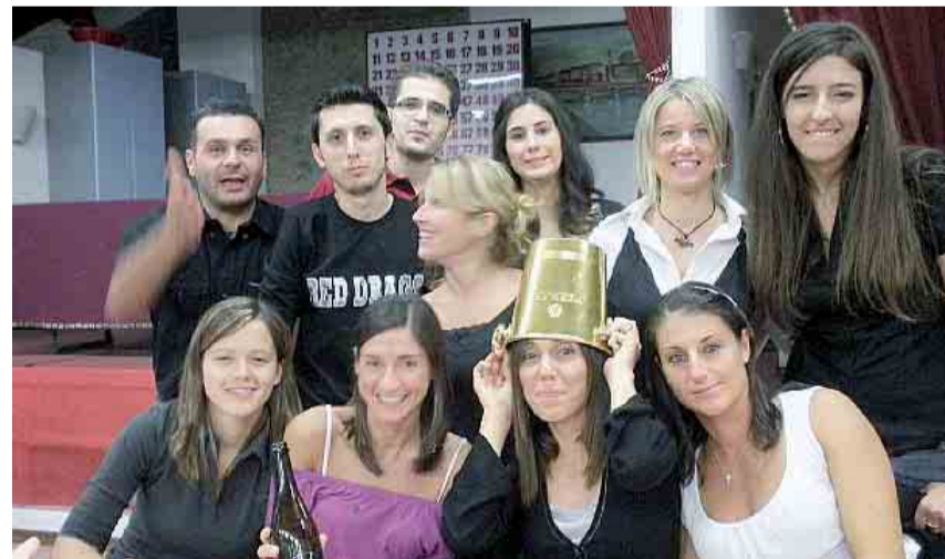
Un momento di festa