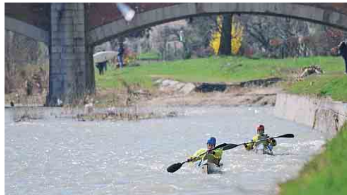
Canoe nella Parma. La seconda edizione a partire dalle 11 di domenica prossima

continua nel suo coinvolgimento a 360 gradi nello sport. Le premiazioni inizieranno intorno alle ore 15 e si svolgeranno al Palalotici di via Po. La manifestazione prevede la partecipazione di diversi canoisti che si daranno battaglia nel tentativo di portare a casa un risultato prezioso.